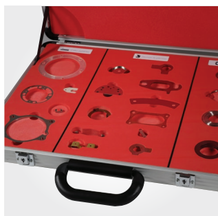
Valise pour pièces métalliques de précision