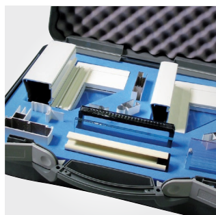
Valise pour échantillons menuiseries