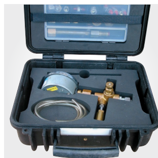
Mallette de maintenance