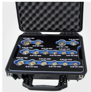
Valise matériel hydraulique