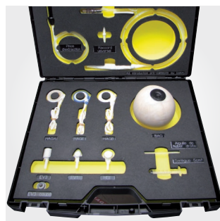
Valise pour matériel médical