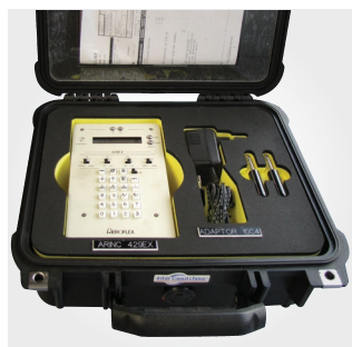
Mallette matériel électronique