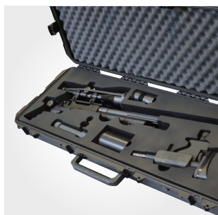
Mallette armes militaires

Protéger les zones à risques exposées aux passages d'hommes ou d'engins dans les ateliers (bâtiment, poutre IPN, machine...). Protéger les pièces sensibles durant les opérations de maintenance ou d'assemblage.