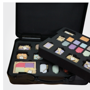
Valise pour échantillons cosmétique